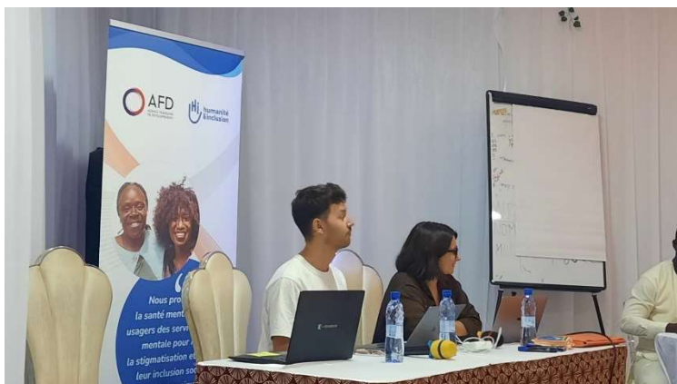
L'équipe française durant la formation