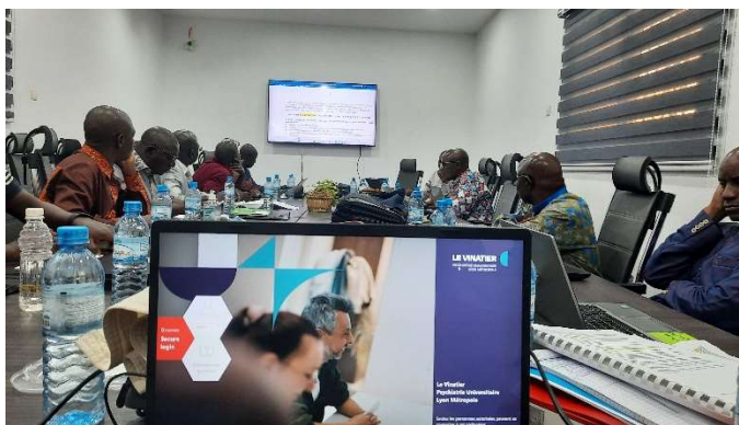
Les participants à l'atelier sur l'élaboration du PNSM 2004-2028