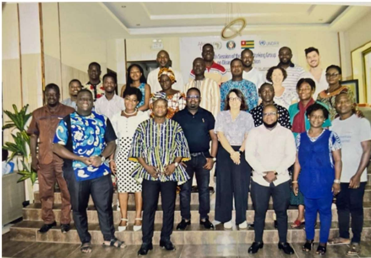
Photo de famille à la fin de la formation