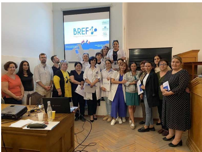
Photo de famille à l'issue de la formation des soignants arméniens