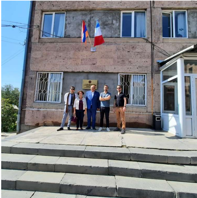
L'équipe française avec la Direction de l'hôpital psychiatrique de NOUBARASHEN