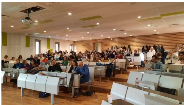
Participants à la journée de la coopération internationale du CH LE VINATIER