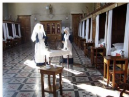
soeurs dans la salle des malades