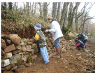
formation à la pierre seche