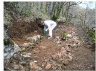
formation à la pierre seche préparation