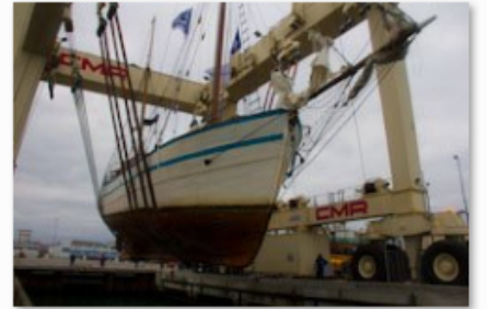
Arawak à sec pour travaux