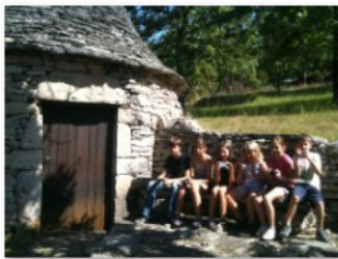
concours photos un groupe de photographes