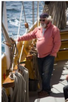
sur le pont