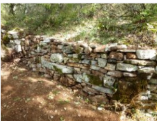
mur de pierre seche rénové