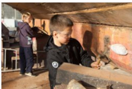
Travux avec enfants