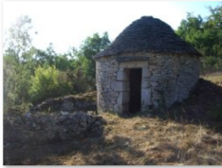
caselle après débroussaillage