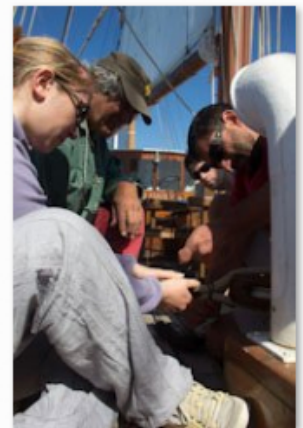
jeunes en navigation