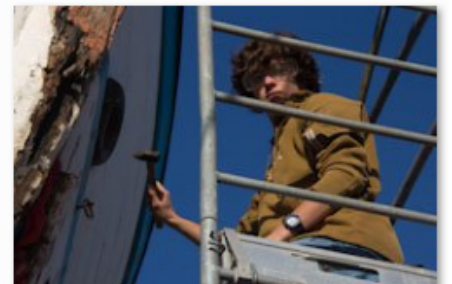
Travaux avec jeunes