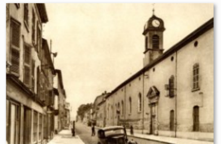
façade Hôtel Dieu