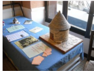
concours photo le public a voté