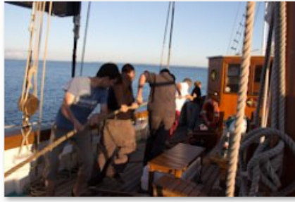
Arawak - pont