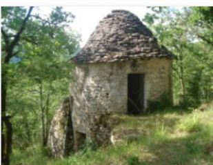
une cazelle fortifiée