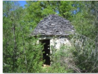
caselle avant débroussaillage