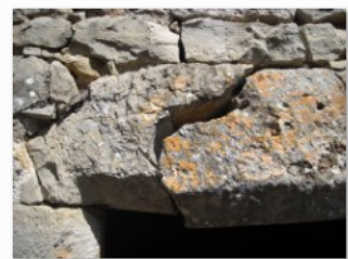
linteau à remplacer