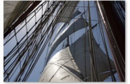
Arawak - voiles