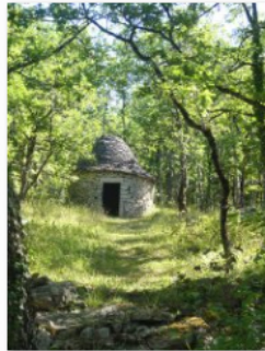
concours photo la gagnante du vote du public