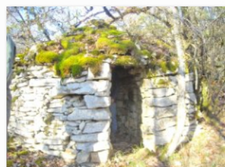
une future nouvelle caselle sur le circuit