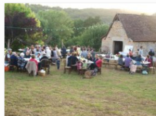
soiree four à pain